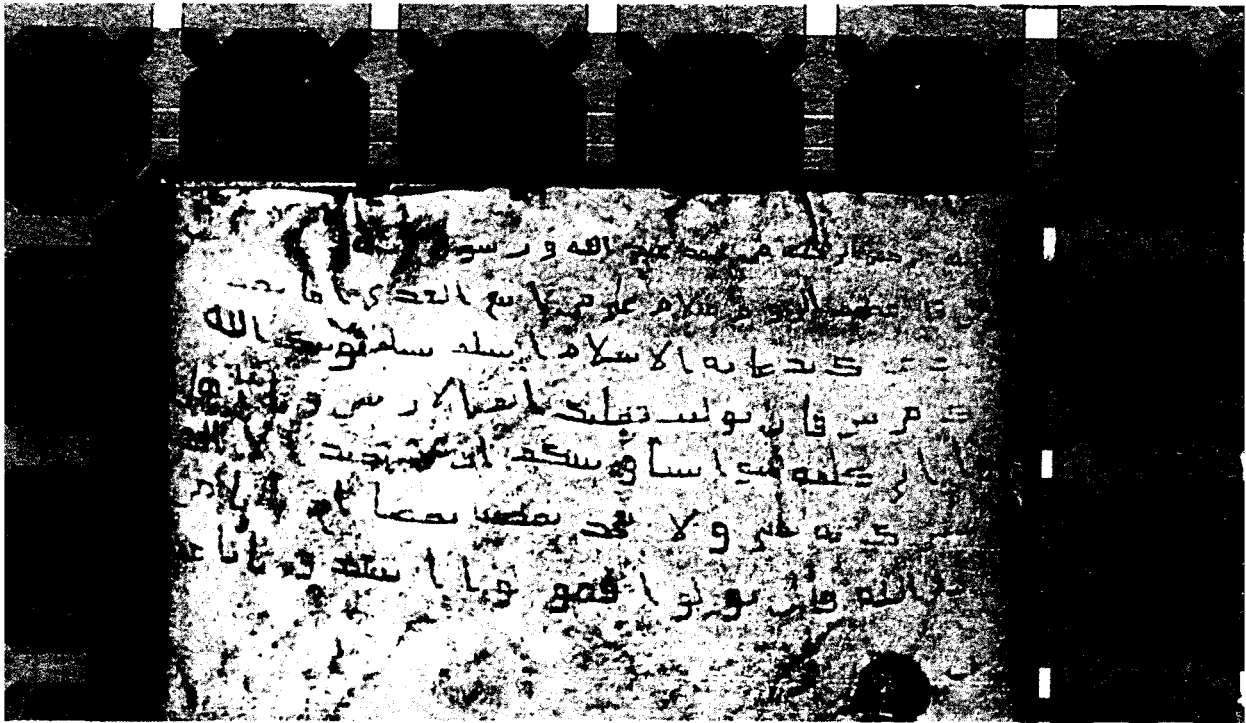
(كتاب رسول الله صلى الله عليه وسلم إلى هزبل)